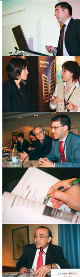
Fotos de CIS-ES 2007

Hacia mediados de junio del 2008 se publicará el avance de programa. Los títulos definitivos de las ponencias y los ponentes confirmados serán publicados en el programa final. La versión actual se encuentra en www.solarpraxis.de > congresos